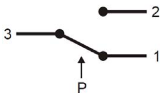
Рис2. Подключение проводов к реле

Для подключения реле давления к системе управления и автоматизации рекомендуется использовать экранированный кабель сечением от 0,2 мм 2 . до 1,5 мм 2 .